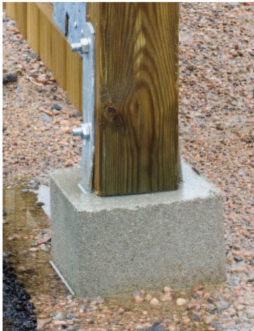
Fast betongplint från Weber.