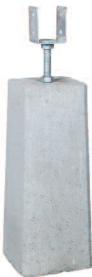
Justerbar plint i 50 cm och 70 cm.

Används när man önskar ett visst mått av avvägning i grundkonstruktionen, där flexibilitet och hållfasthet efterfrågas.